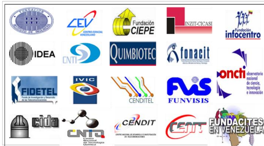
Imagen No. 3 Organismos adscritos al Ministerio del Poder Popular de Ciencia, Tecnología e Innovación

De acuerdo la imagen No. 2, la certificación de cumplimiento se sustenta en el cumplimiento de los deberes formales con la intención de comprobar la aplicación de los mismos, considerando el registro y la declaración de ONCTI, el registro contable sustentado en su libro auxiliar de ser necesario. Además, según la ley derogada LOCTI (2005 y 2010), los proyectos, los contratos de transferencia tecnológica, los comprobantes de aportes, transferencias, comprobación física de las inversiones de los proyectos. En la actualidad, según LOCTI (2014), la certificación de cumplimiento se sustenta en la ejecución del proceso de liquidación del aporte, a saber: determinación, declaración y pago del mismo. Este proceso, será avalado y fiscalizado por alguno de los organismos adscritos al MPPCTI, ver la imagen No. 3.