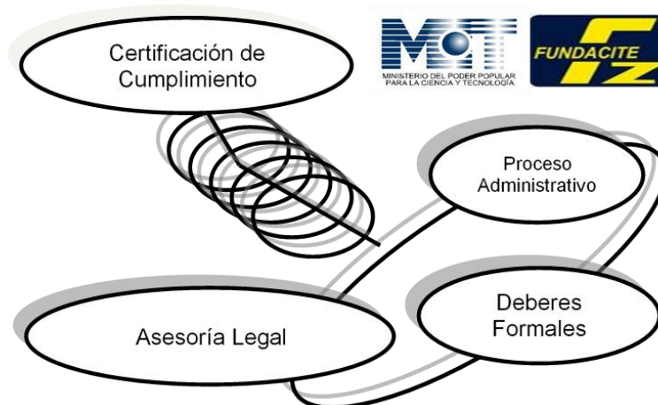
Imagen No. 2 Captación de recursos para la promoción del desarrollo científico y tecnológico

De acuerdo a lo establecido por la ley, su actividad principal está abocada a la captación de los recursos económicos provenientes de los ingresos brutos o los beneficios económicos que obtiene la gran empresa o sujeto obligado e integrante del Sistema para Declaración y Control del Aporte Inversión en Ciencia, Tecnología e Innovación (SNCTI), por cualquier actividad que realice, sin tomar en consideración los costos o deducciones en que haya incurrido para obtener dichos Ingresos. Posteriormente, los administra y reporta al Ministerio, otorgando a cada empresario la certificación de cumplimiento ante estos aportes exigidos. La imagen No. 2, esquematiza la actividad central de este organismo ante la captación de recursos para la promoción del desarrollo científico y tecnológico.